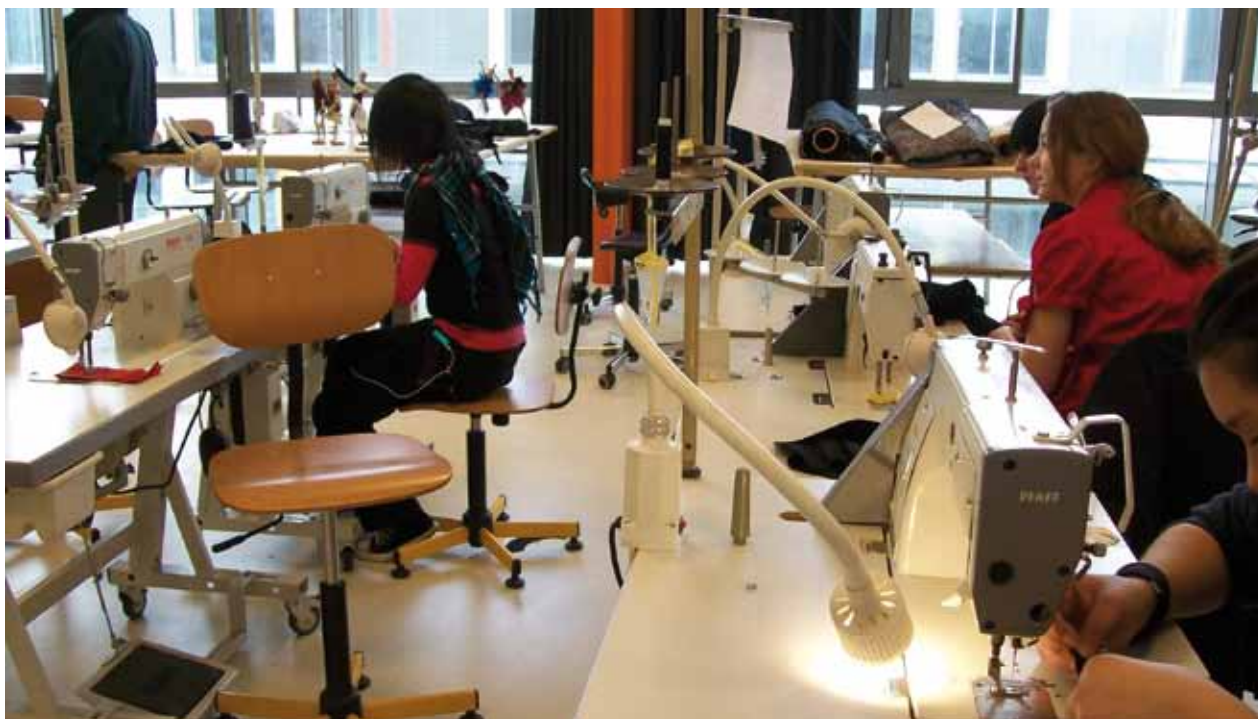
Lycée Elisa Lemonnier - Paris - Section mode.