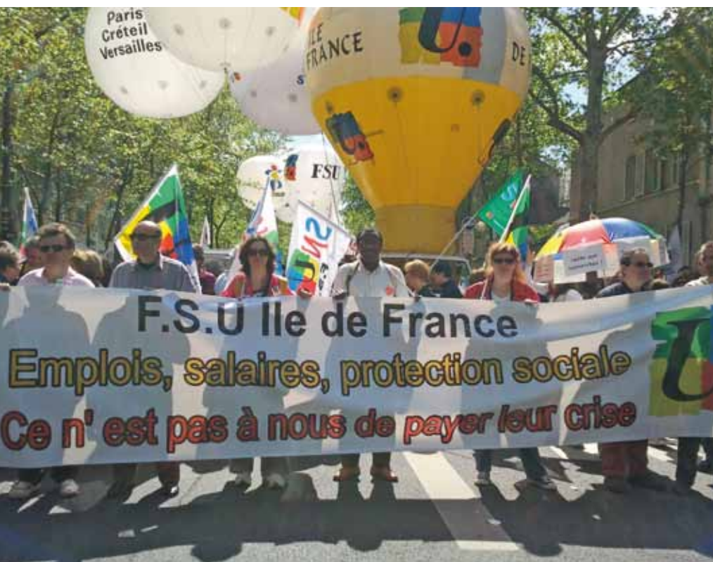
Manifestation du 1 er Mai - Paris 2012

Le décret n°2012-631 du 3 mai 2012 déterminant les conditions dans lesquelles les agents non-titulaires de la Fonction publique de l'État peuvent accéder à des « recrutements réservés » valorisant les acquis professionnels, est publié au Journal officiel du 4 mai 2012.