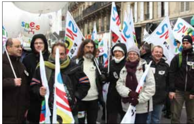
PLP de la SEP de Mamers à la manifestation du 31 janvier 2012 à Paris.

Les effectifs de la SEP de Mamers ne sont pas inférieurs à ceux des autres établissements du département. Le Bac Pro TU connaît depuis plusieurs années des difficultés pour recruter. La fermeture d'une section pour augmenter les effectifs d'un autre établissement a été faite par le rectorat dans