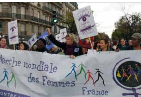
Manifestation 'Contre les violences faites aux femmes' - Paris 5 novembre 2011.

L'affaire DSK a exposé au grand jour la permanence du sexisme en France. Les propos misogynes et scandaleux exprimés sans complexe par des journalistes, des politiques voire par des pseudos intellectuels sont effarants de sottises et dramatiques. Pour n'en citer que quelques-uns : Jack Lang « il n'y a pas mort d'homme » autrement dit même si c'est un viol, ce n'est pas grave ; JF Kahn, ce n'est qu'un « trous-