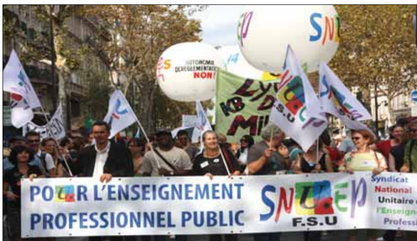
Manifestation - Paris 27 septembre 2011.

Le SNUEP-FSU est très inquiet de l'avenir de la formation des PLP. Malgré l'élaboration de maquettes master « Enseignement Professionnel », le vivier se réduit et de nombreuses