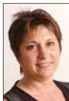
[ Bernadette Groison