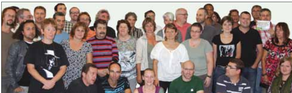
Conseil National septembre 2011.