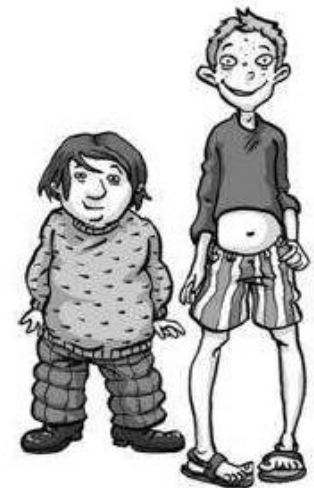
Illustration de Wiebke Petersen