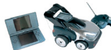
JOUETS / LOISIRS