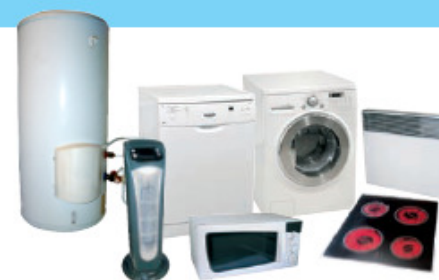
LAVAGE / CUISSON / CHAUFFAGE