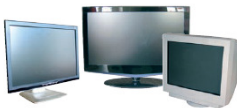
TÉLÉVISEURS / MONITEURS