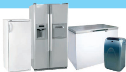
RÉFRIGÉRATEURS / CONGÉLATEURS / CLIMATISEURS