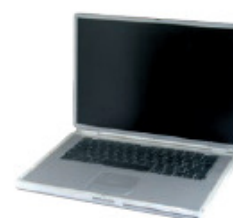
ORDINATEURS PORTABLES / ÉCRANS