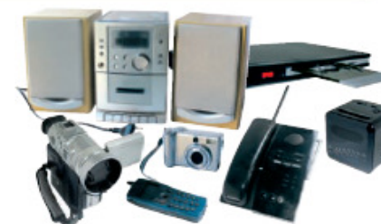
AUDIO / VIDÉO / TÉLÉPHONIE