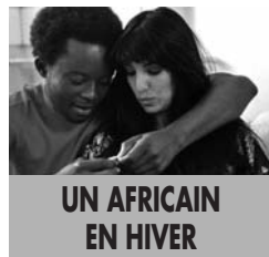
UN AFRICAIN EN HIVER