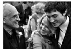
ANOTHER HAPPY DAY

de Sam Levinson Avec Ellen Barkin, Ezra Miller, Kate Bosworth USA - 2012 - 1h55 - Vo.st Genre : Comédie Du 29 mars au 3 avril Jeu : 21h - Ven : 18h15 - Sam : 18h30 Dim : 21h - Mar : 18h30