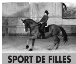
SPORT DE FILLES

de Patricia Mazuy Avec Marina Hands, Josiane Balasko, Bruno Ganz France - 2012 - 1h41 Genre : Drame, Sport Du 14 au 20 mars Mer : 16h et 21h15 - Jeu : 18h30 - Ven : 18h30 - Sam : 18h30 - Dim : 21h15 - Mar : 18h30