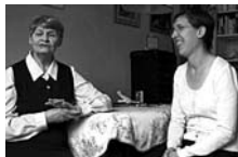
LES VOIX DE MA SOEUR

"Les voix de ma sœur" est un portrait et un témoignage. Il prend la forme d'un journal intime à plusieurs voix : celle d'une patiente décrivant avec lucidité sa pathologie, celle de sa famille combattant la culpabilité et le déni, celles de ses soignants de l'hôpital Sainte-Anne à Paris. Ce document à vocation de désigmatisation des personnes souffrant de troubles schizo-phréniques et de sensibilisation au travail des familles et des soignants.