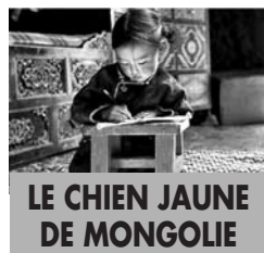
LE CHIEN JAUNE DE MONGOLIE

de Byambasuren Davaa Avec Urjindorj Batchuluun, Daramdadi Batchuluun, Nansa Batchuluun Mongolie - 2006 - 1h33 - V.f Genre : Comédie dramatique Tous public dès 6/7 ans