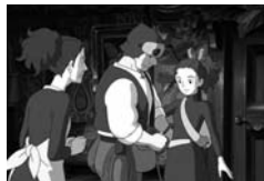
ARRIETTY LE PETIT MONDE DES CHARPEURS

Ce film est une oeuvre poétique, une métaphore du paradis perdu où s'entremêlent les passions et la nature humaine. Nourit le classicisme du trio amoureux et les différences de classe sociales, il met deux hommes et une femme aux prises avec le contexte rural et agricole de la fin du XIX e siècle, quand le Far West finissait de laisser progressivement la place à la civilisation industrielle.