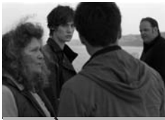
ANGELE ET TONY