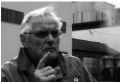
DE MÉMOIRES D'OUVRIERS