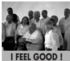
I FEEL GOOD !