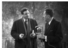
LE DISCOURS D'UN ROI

Interprété par trois acteurs exceptionnels, Colin Firth, Geoffrey Rush et Helena Bonham Carter, entourés de comédiens de seconds rôles comme seuls les Britanniques savent en donner, "Le discours d'un roi" est un film émouvant sur l'amitié, sur l'amour conjugal aussi, l'histoire de l'homme qui ne voulait pas être roi mais qui, le devenant, dut annoncer à son peuple l'entrée en guerre de l'Empire britannique, puis l'accompagner au cours de l'une des pires épreuves de son histoire.