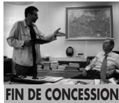
FIN DE CONCESSION

de Pierre Carles Avec Jean-Marie Cavada, Jacques Chancel, Jean-Pierre Elkabbach France - 2010 - 2h11 Genre : Documentaire