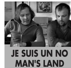
JE SUIS UN NO MAN'S LAND

Fergus persuade son ami d'enfance Frankie d'intégrer son équipe d'agents de sécurité, à Bagdad, pour un salaire mensuel de 12.000 livres, non imposable. C'est leur dernière chance de "se faire du blé" dans cette guerre dont la privatisation va croissant. Ensemble, ils vont risquer leur vie dans une ville où règnent la violence, la terreur, l'impunité et l'avidité. Une ville par ailleurs inondée de milliards de dollars américains. Mais Frankie meurt sur la "Route Irish", la route la plus dangereuse de Bagdad. Fergus rejette l'explication officielle et, brisé par le chagrin, retourne à Liverpool où il entame sa propre enquête sur la mort de son alter ego.