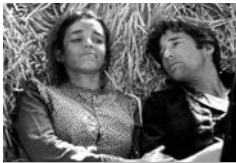
LES MOISSONS DU CIEL

de Terrence Malick Avec Richard Gere, Brooke Adams, Sam Shepard USA - 1979 - 1h35 - Vo.st Genre : Drame , Romance