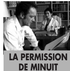
LA PERMISSION DE MINUIT