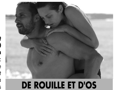
DE ROUILLE ET D'OS

Du 20 au 26 juin Mer : 16h - Sam : 18h30 Du 27 juin au 3 juillet Mer : 16h - Dim : 11h