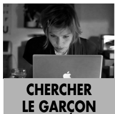
CHERCHER LE GARÇON