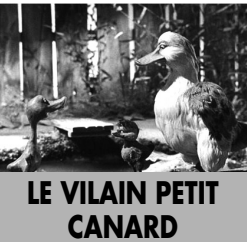
LE VILAIN PETIT CANARD

Il était une fois une basse-cour où coqs, poules, canards et oies vivaient et couvaient de concert. Un beau jour, le coq découvre un œuf énorme qu'il rajoute discrètement à la couvée de sa compagne... Mais quand l'oisillon voit le jour, il ne ressemble à aucun de ses congénères ! Il se retrouve ainsi très vite mis à l'écart par toute la basse-cour, subissant les humiliations et les moqueries de ses compagnons à plumes. Mais un jour, le vilain petit canard deviendra un magnifique cygne blanc. Du célèbre conte d'Andersen, Garri Bardine fait une fable politique et ironique, digne de "La Ferme des animaux" d'Orwell. (...) Plaidoyer anticaricature, anticommuniste, antidictature... le conte ne néglige pas pour autant le merveilleux : tout en teintes sourdes, du brun au roux, en passant par le bleu mélancolique d'un ciel délavé, il fourmille d'inventions visuelles, pétillante de poésie.