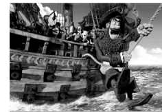
LES PIRATES ! BONS À RIEN, MAUVAIS EN TOUT