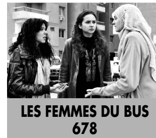
LES FEMMES DU BUS 678

Devant l'ampleur du mouvement, l'atypique inspecteur Essam mène l'enquête. Qui sont ces mystérieuses femmes qui ébranlent une société basée sur la suprématie de l'homme ?